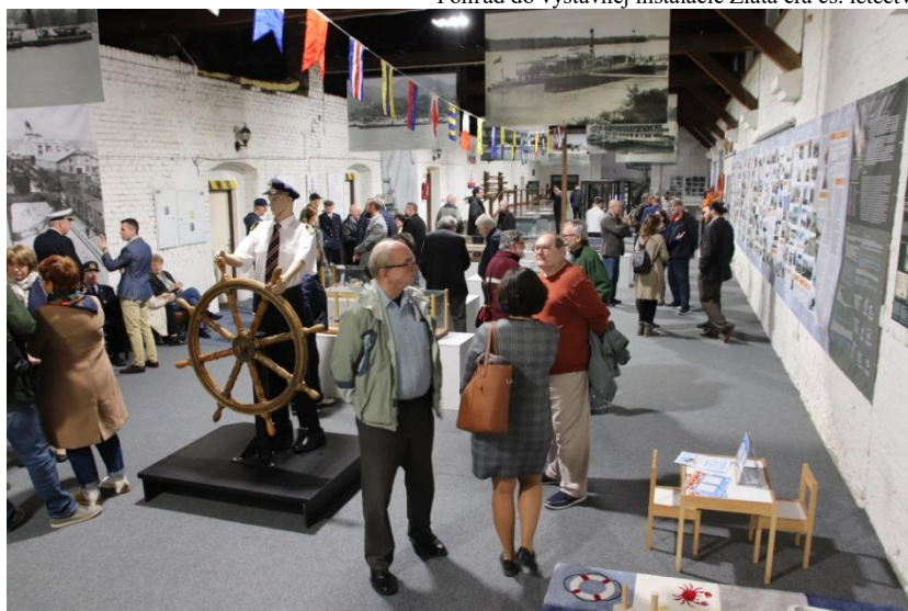
Pohľad do výstavy 100 rokov lodiarstva v STM-Múzeu dopravy v Bratislave