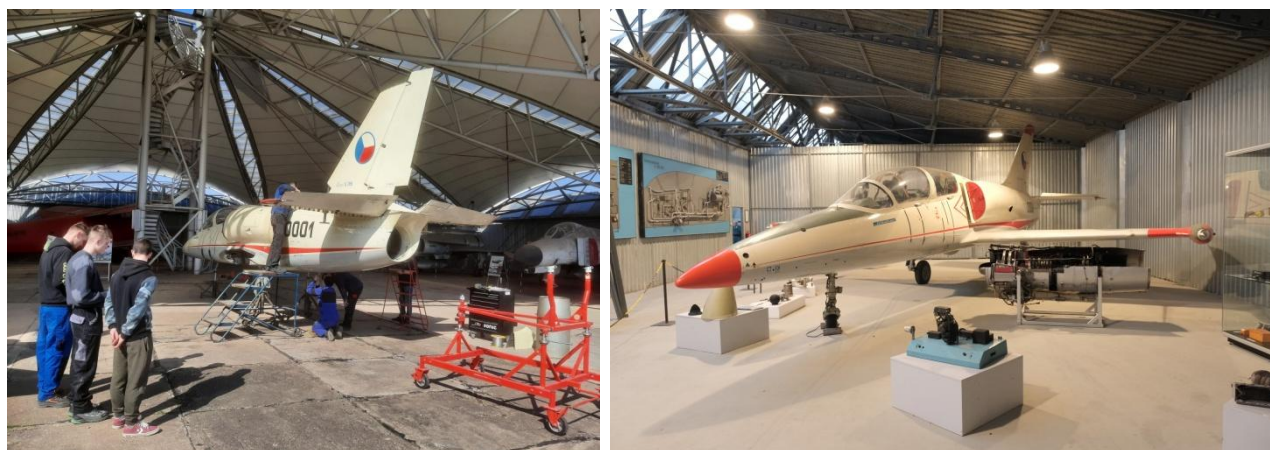
Transport lietadla L-39 v. č. 0001 z LF TUKE, reštaurovanie a výstavná inštalácia „Zlatý vek čs. letectva“ v STM-Múzeu letectva v Košiciach

V roku 2022 sa STM podarilo definitívne doriešiť situáciu vlastníckych práv/správy prístavného remorkéra Zvolen , ktorý je evidovaný v zbierkovom fonde STM už od roku 2018 (odplatný prevod správy). STM zároveň riešilo otázku ďalšieho umiestnenia tejto lode vo viacerých alternatívach, najmä s ohľadom na urgentnú potrebu zhodnotenia reálneho stavu ponorenej časti lode a potrebných zásahov odborného ošetrovania i s ohľadom na hospodárne a účelné vynaloženie financií. Loď je stále umiestnená v bazéne Zimného prístavu, nutné je jej vyťahnutie a základné očistenie trupu a likvidácia zvyšných ropných produktov a odpadu. STM v daných aktivitách zásadne obmedzuje nedoriešená systematická finančná podpora zriaďovateľa na odbornú správu veľkorozmerných zbierkových predmetov v zbierke Doprava železničná a vodná a jej ďalšie budovanie.