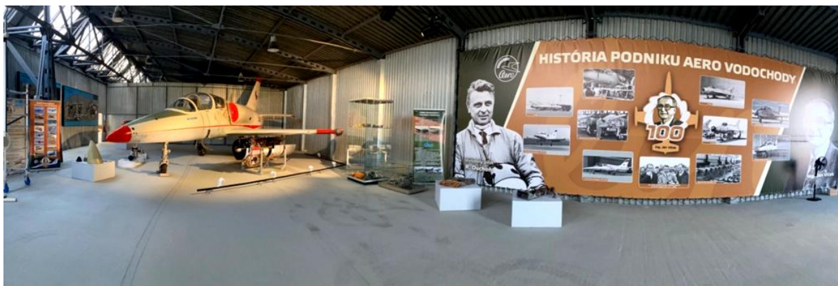
Pohľad do výstavnej inštalácie Zlatá éra čs. letectva