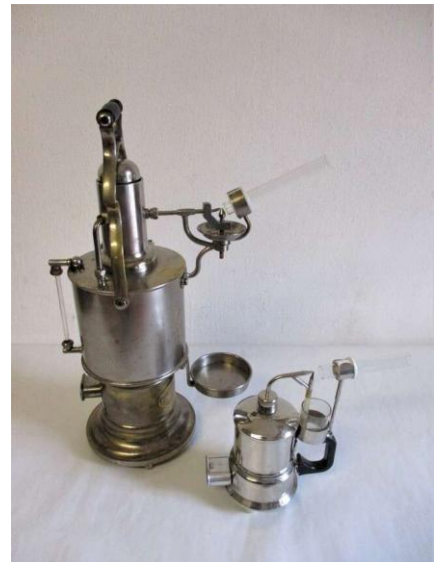
Prístroj inhalačný, príř. č. 1998/00152, ev. č. Ch 00500