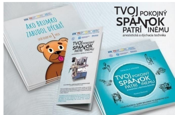
Pohľad do výstavy Tvoj pokojný spánok patrí inému. Anestetická a dýchacia technika a vydané edičné tituly k výstave