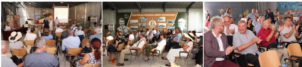
Konferencia Zlatá éra čs. letectva, 28. a 29. 6. 2022, zábery z prvého dňa konferencie v STM-Múzeu letectva v Košiciach