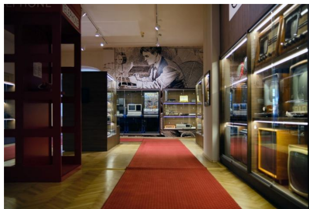
Pohľady do novej expozície Elektrovek. 200 rokov elektrotechniky