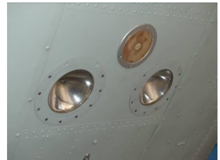
Vrtulník Mi-8 PS-9 e.č.2839 montáž a kompletácia klimatizácie, ohrevu, svetlá, príř. č. 2016/00096, ev. č. L 01264