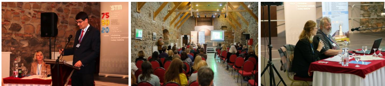
Konferencia Tradície soľného baníctva v Karpatskom oblúku, 29. 9. – 1. 10. 2022, zábery z prvého a druhého dňa konferencie v STM-Múzeu Solivar v Prešove

V dňoch 29. septembra až 1. októbra 2022 STM realizovalo medzinárodnú konferenciu „Tradície soľného baníctva v Karpatskom oblúku“. Na konferencii v 4 tematických blokoch odznelo 10 informačne exponovaných konferenčných príspevkov, z ktorých každý obohatil mozaiku podchytených informácií o špecifickej oblasti kultúrneho dedičstva – banského soľného dedičstva. Odborného podujatia sa zúčastnilo takmer 100 účastníkov – zástupcov zo špecializovaných múzeí zo Slovenska a Poľska, zástupcov pamiatkovej starostlivosti, banských prevádzok, akademickej obce atď., naplnili tematické okruhy venované histórii a potenciálu soľnobanskej bane, silno zarezovali príspevky pripomínajúce zdedený dlh v oblasti relevantného prístupu k banským priestorom po ukončení ťažby a inšpirovali príspevky k tematike zahraničnej spolupráce a výziev pre muzealizované banské soľné dedičstvo v kontexte kultúrnej turistiky. Podujatie bolo realizované pri príležitosti 50. výročia založenia STM-Múzea letectva v Košiciach. Z konferencie vydalo STM zborník príspevkov tlačou aj online < https://stm-ke.sk/asset/uploads/odborne-cinnosti/edicna-cinnost/zbornik_tradicie_solneho_banictv.pdf >.