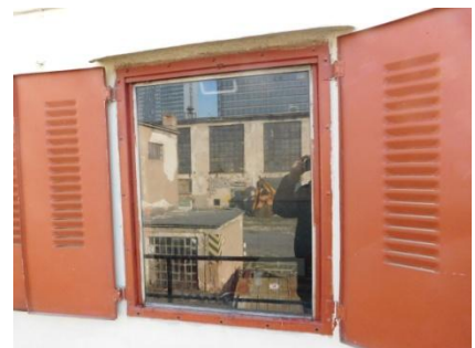
Ukážky z renovácie okien a okenných systémov NKP Lod' Šturec – 4. etapa projektu Reštaurovanie remorkéra Šturec