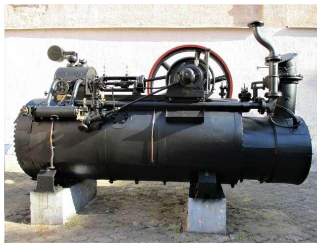
Stroj parný zn. R. Wolf, príř. č. 2000/00062, ev. č. Str 00744